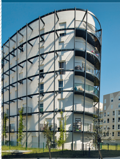
Éco-quartier Fort d'Issy, Issy-les-Moulineaux