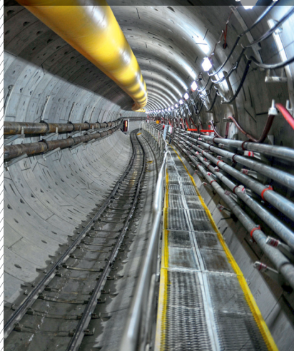
Tunnel ferroviaire MTR 703, Hong Kong