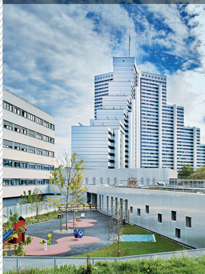
Logements Sillon de Bretagne, Nantes