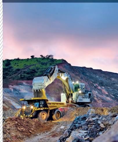
Mines de Kibali, RDC