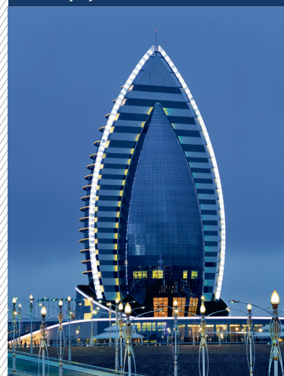
Hôtel Yyldyz, Turkménistan