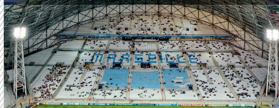
Stade Vélodrome, Marseille