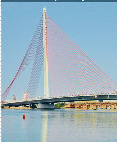
Pont de Tran Thi Ly, Da Nang, Vietnam