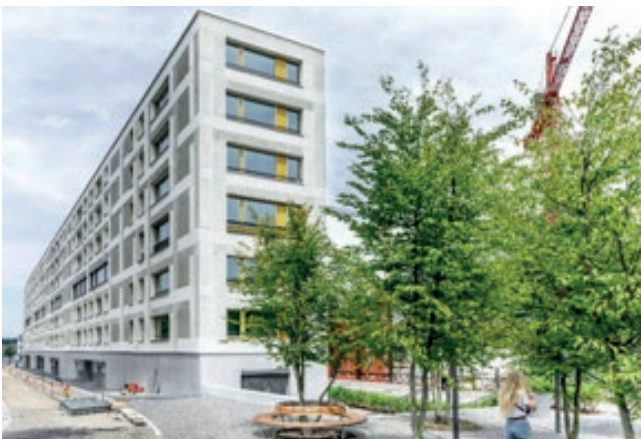
L'écoquartier Greencity (Zurich, Suisse)

https://www.wwf.fr/champs-daction/climat-energie/reinventer-villes